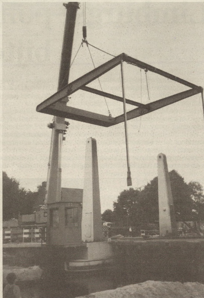
Het bovengedeelte van de brug is los.