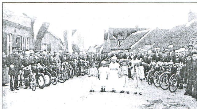
Meijelse Fietsclub in 1904