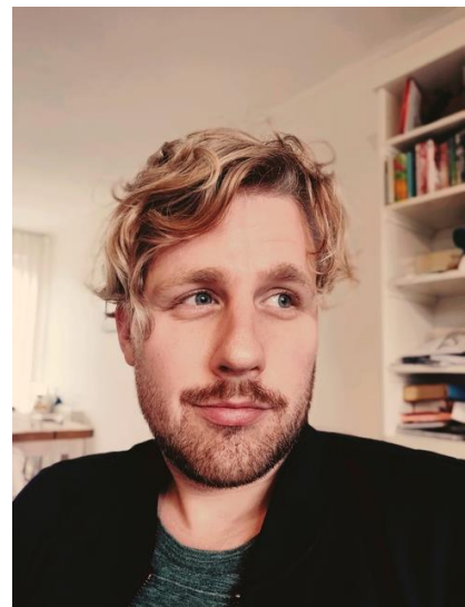
Kees-Jan Mulder, maker van de docu.