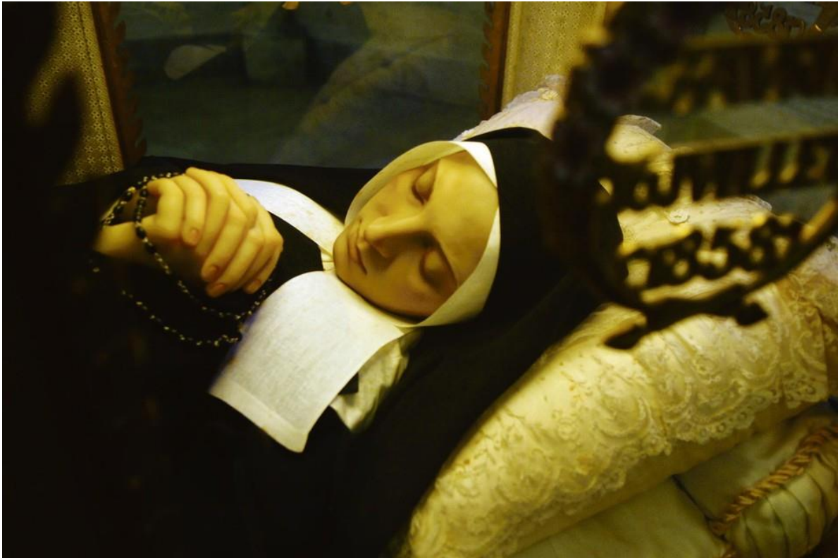
Het geconserveerde lichaam van Bernadette Soubirous. — © Getty Images

Bron: dagblad De Limbirger (online) van 31-3-2024 door Pascale Thewissen