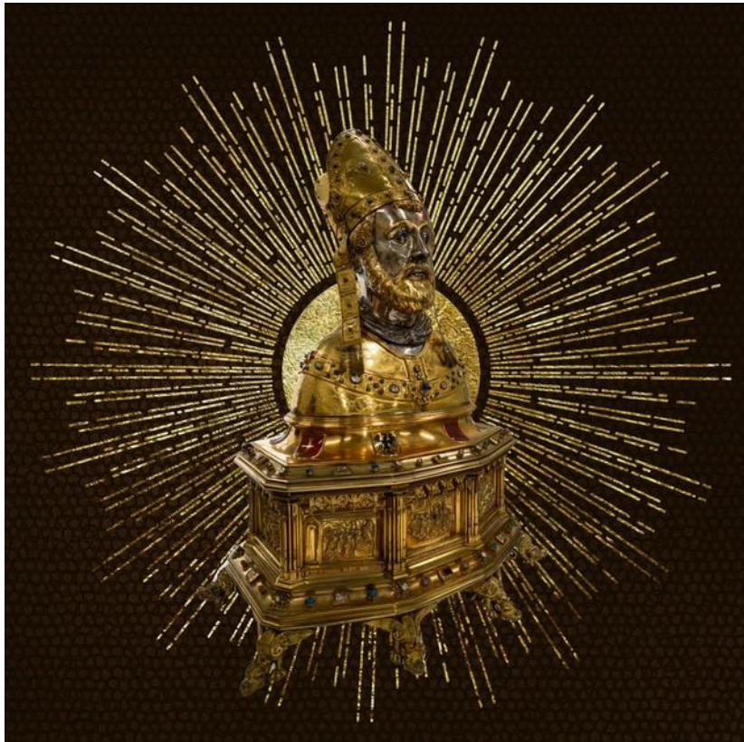
Borstbeeld met een deel van de schedel van Sint Servaas uit 1580 met elementen uit 1400.

ontvangenis'. In de maanden die volgen zal Maria nog zeventien keer aan Bernadette verschijnen. Ze vraagt haar een kerk te bouwen bij de geneeskrachtige bron die in de grot ontspringt.