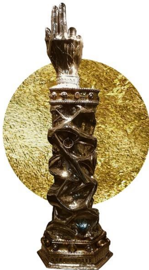
Thomasarm uit de Sint Servaas in Maastricht met een bot dat van de rechterarm van apostel Thomas zou zijn geweest. Waarschijnlijk uit ongeveer het jaar 1500.