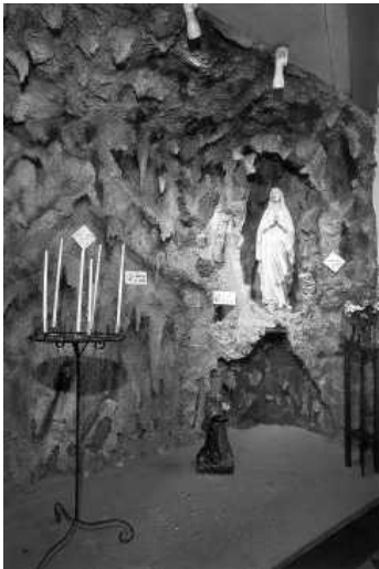
Grot achterin de kerk met beelden O.L.V. van Lourdes en Bernadette