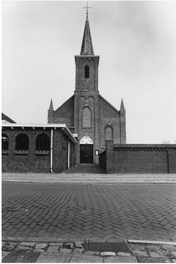
St. Bavokerk Groede