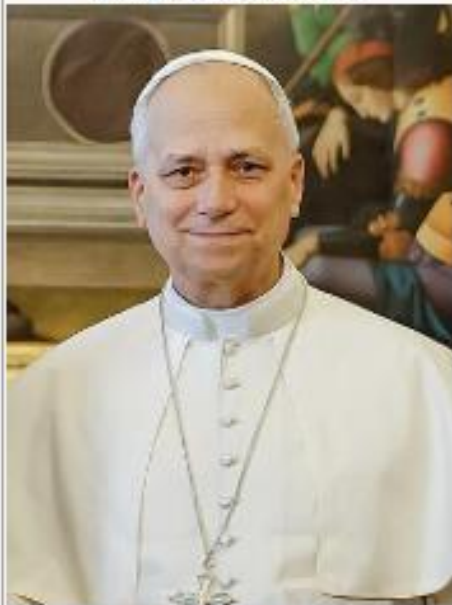
Paus Leo XIV in 2025