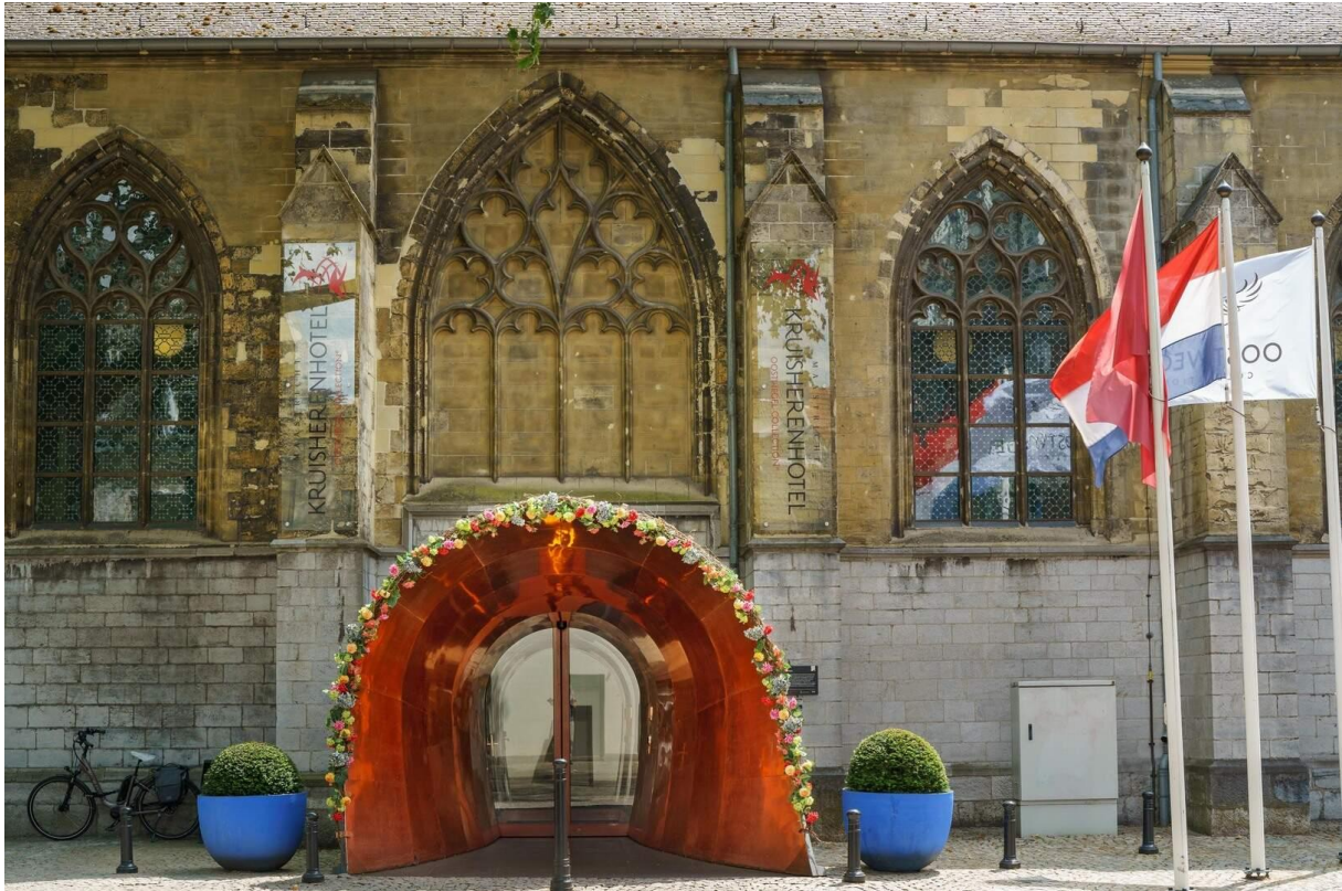
Het Kruisherhotel in Maastricht.

Bron: dagblad De Limburger (online) van 14-05-2026 door Bernd Müllender