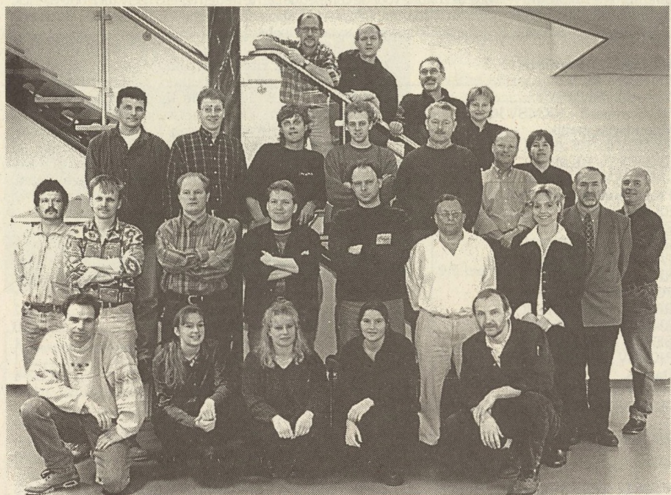
Medewerkers De Gouden Leeuw drukkerij b.v. (wegens ziekte ontbreken enkele medewerkers)